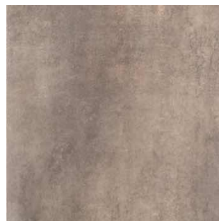
AMBRE GREIGE | Novedad 65x65