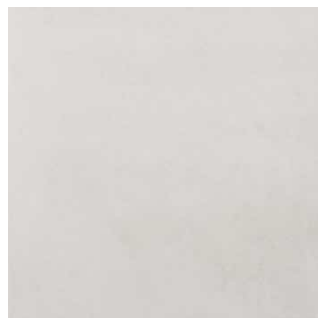
AMBRE BLANCO | Novedad 65x65