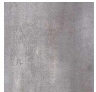
AMBRE GRIS | Novedad 65x65