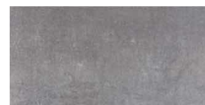
AMBRE GRIS | Novedad 30x60