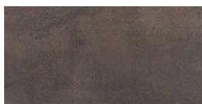
AMBRE ANTRACITA | Novedad 30x60