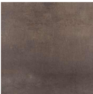
AMBRE ANTRACITA | Novedad 65x65